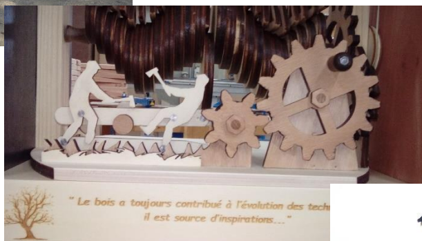
Challenge Bois en atelier Menuiserie