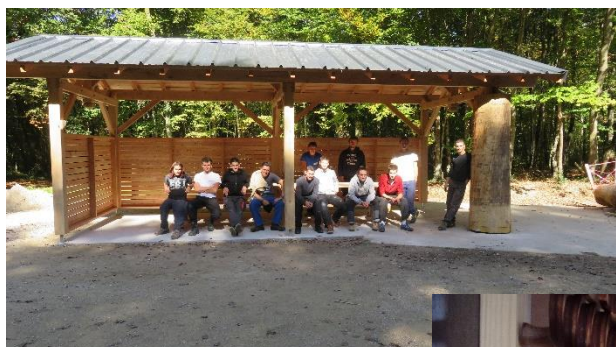
Projet ONF en forêt de SEILLON Charpente et Couverture