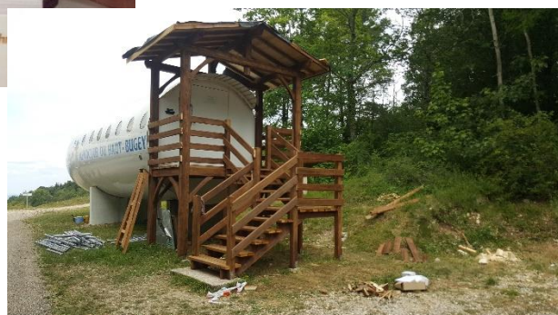
Altiport de CORLIER Charpente et Couverture