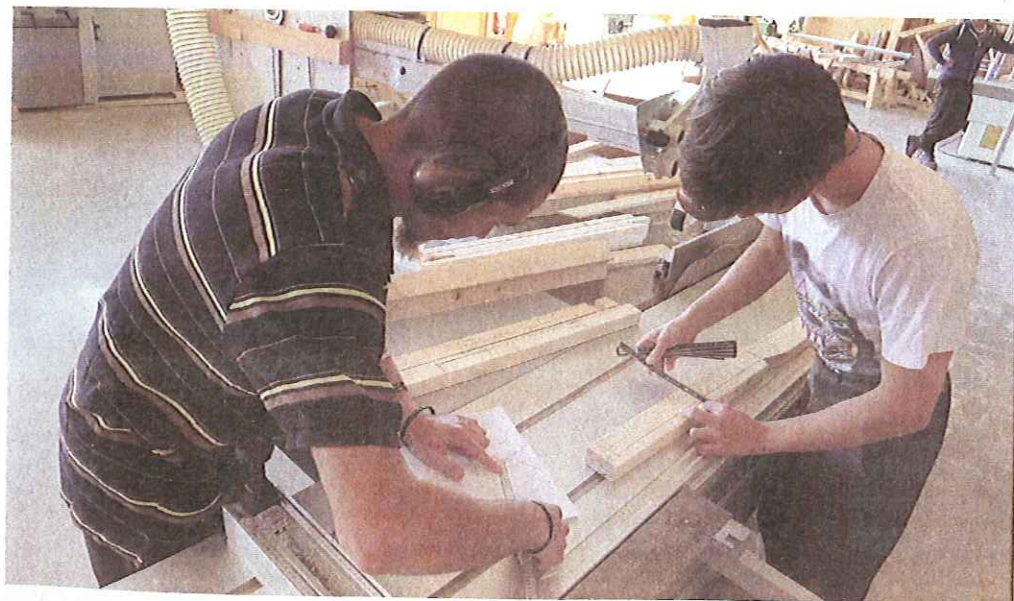
L'apprentissage, une spécialité de la MFR.