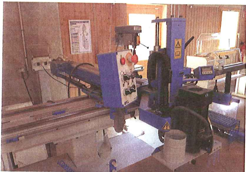
Les élèves apprennent avec du matériel moderne (ici, une défonceuse Pouwels).